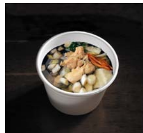
お湯を注ぐだけで簡単鍋が