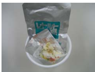
中にはレトルト具材やスープなど