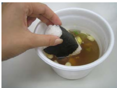
おにぎりをいれて雑炊風に