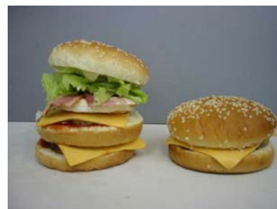
通常のハンバーガーとの比較。左が今回の商品。総重量で 2 倍以上のボリューム。

BLJ は、Big・Large・Jumbo の頭文字から。ハンバーグパティ、オムレツ、ベーコン、レタス、チェダーチーズを使用し、マヨネーズとケチャップでジューシーに仕上げました。パンもダブルスライスカットした 2 層仕立てとなっています。総重量で通常商品の 2 倍以上のボリュームです。4 週間限定。