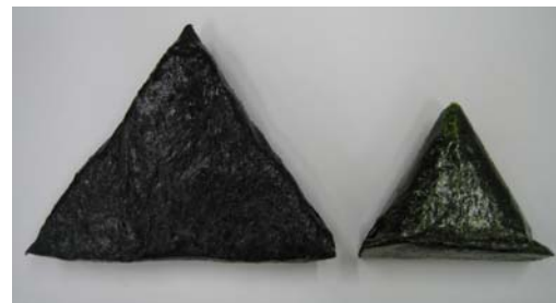
通常のおにぎりとの比較。左が今回の商品。総重量で約 2.8 倍のボリューム。