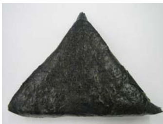
底辺約 16 cm × 高さ約 12 cm の三角タイプの大きな直巻おにぎりに！