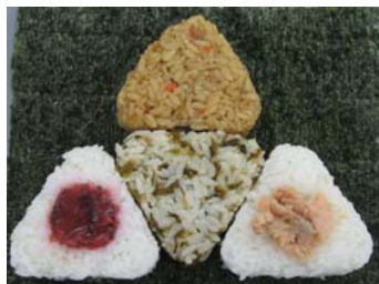
4 種類のおにぎりを海苔で丸々包みます。

「焼鮭・紀州しそ梅・辛子高菜・鶏五目」を具種とした約 70 g 相当のおにぎり 4 種類（総重量で約 290 g 相当）を海苔で丸々包み、見た目にも大きさが伝わる大きな三角タイプの直巻おにぎりです。総重量で通常商品の約 2.8 倍のボリュームです。3 週間限定。