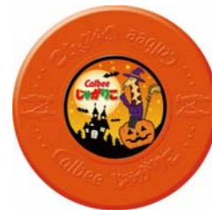
●じゃがりこのふた

じゃがりことプリングルズの対象商品に、ハロウィンなどのオリジナルデザインを施したおまけを添付します。じゃがりこには、じゃがりこの麒麟のキャラクターが描かれたオリジナルのじゃがりこのふたが付いてきます。ふたのデザインは、全5種類があります。プリングルズには、プリングルズのパッケージの上にハロウィンかぼちゃがデザインされたストラップが付いてきます。全3種類のデザインがあります。どちらも数量限定となっています。