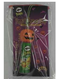
●プリングルズ ストラップ