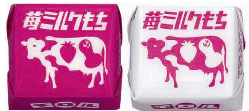
●チロルチョコ苺ミルクもち

10月26日(日)AM10時から、保護者同伴の12歳以下のお子様を対象に、数量限定で「チロルチョコ苺ミルクもち」を無料配布します（各店100個。無くなり次第終了となります）。「チロルチョコ苺ミルクもち」は、過去にアソート商品の一部として販売されたことはありますが、単品で販売されたことは無い希少性が高い商品です。もちグミを苺ミルク味のチョコレートで包んだチロルチョコです。また、レギュラーサイズの「チロルチョコ苺ミルクもち」は、12月3日から、サークルKサンクス限定で販売する予定です。価格は21円(税込)の予定です。