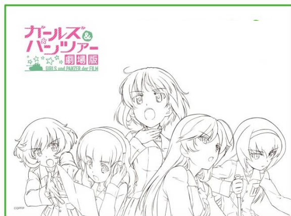
キャンバスアートイメージ

Wチャンス賞：サークルKサンクスプリント L判オリジナル写真ブロマイド 2,000名様 サークルK・サンクス店内のマルチコピー機にて、「ガールズ&パンツァー 劇場版」にちなんだ複数の絵柄の中からランダムでオリジナルブロマイド（L判）が無料でプリントアウトできる、コンテンツ番号をプレゼントします。