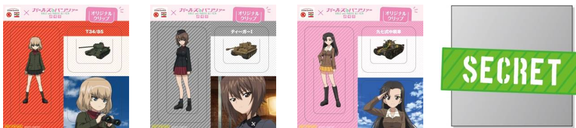
オリジナルクリップデザインイメージ