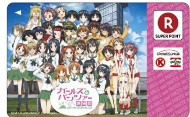
<カードデザインイメージ>

※内、約2000枚を11月15日（日）に茨城県大洗町にて開催される「あんこう祭」にて先行販売します。