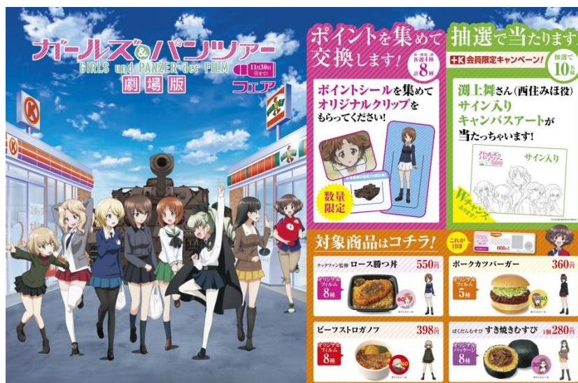
店頭ポスターイメージ