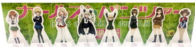
<ペーパーフィギュアイメージ>