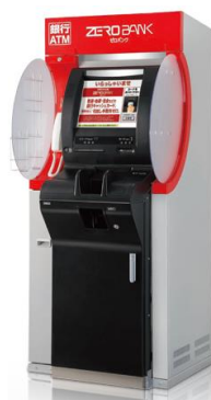
【現行の「ゼロバンク」】

OKB大垣共立銀行、ゆうちょ銀行およびファミリーマートはこれからも、地域のお客さまにご満足いただける便利なサービスをお届けしてまいります。