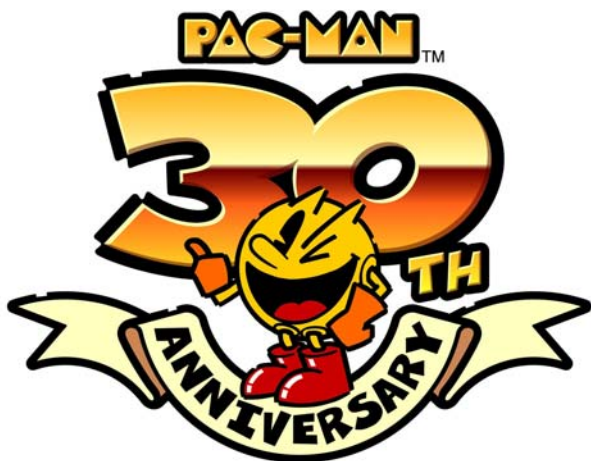
「パックマン」30周年記念ロゴ

『パックマン』シリーズは、1980年にナムコ(現バンダイナムコゲームス)が開発したビデオゲームで、斬新かつ分かりやすいゲーム性と、かわいらしいキャラクターが幅広い層に受け入れられ、世界的なブームとなりました。特に米国での人気はすさまじく、1987年までにワールドワイドで約30万台が販売され、2005年6月にはギネス・ワールド・レコーズ社から「最も成功した業務用ゲーム機」に認定されました。現在でも家庭用ゲーム機や携帯電話用アプリなどに移植され、日本を代表するゲームのひとつとして世界中の人々に愛され続けています。2010年5月22日には生誕30周年を迎え、さらに大きく展開していきます。