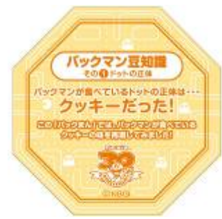
敷き紙イメージ画像(一例)