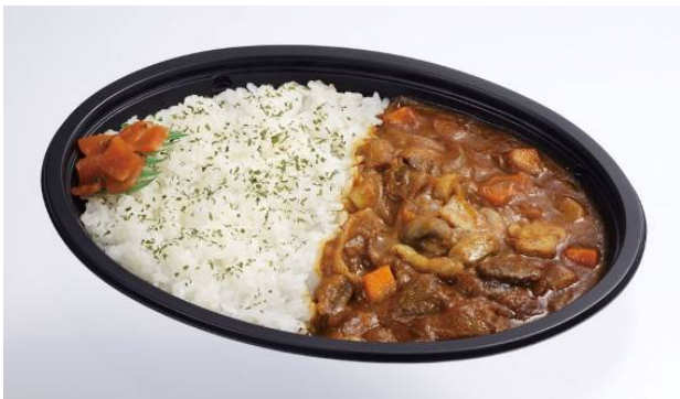
マッシュカレー（舟形マッシュルーム使用）