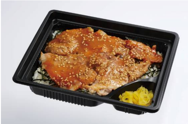
豚味噌焼肉重（山形県産豚肉使用）