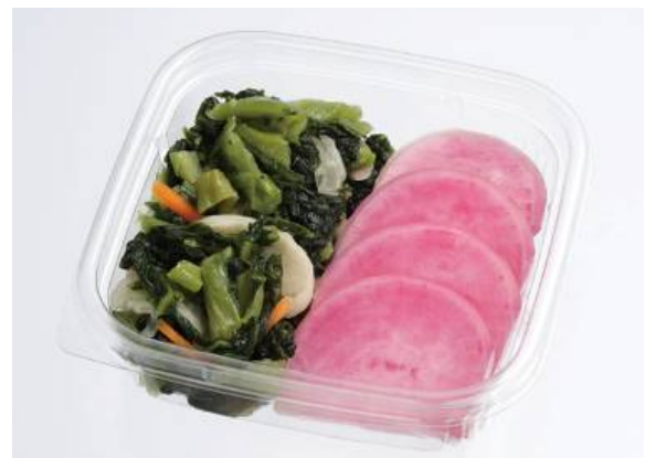
おみ漬け昆布・赤かぶらのセット