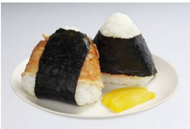
はえぬきおにぎりセット（肉巻き&鮭ほぐし）