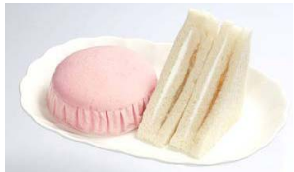
左：白桃ジャム蒸しパン（山形県産白桃使用）