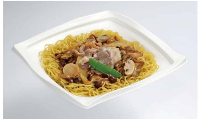
あんかけきのこ焼そば（舟形マッシュルーム使用）